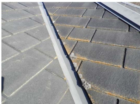
5 コロニアル屋根 藻の繁殖・汚染