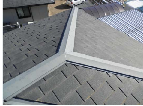
4 コロニアル屋根経年劣化による色褪せ 工程↓ 高圧洗浄・棟部分目荒らし エポキシ樹脂シーラー1回塗り 2液型ウレタン樹脂塗料2回塗り