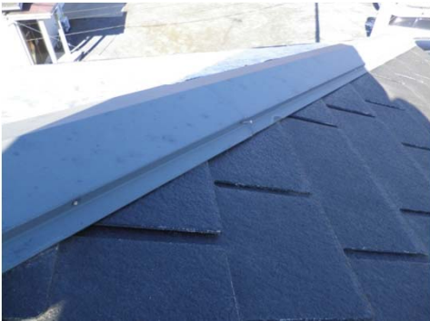
3 棟部分 釘の緩み