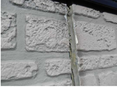
1 ベランダ面シーリング断裂 工程↓ シーリング打ち替え 2面接着工法